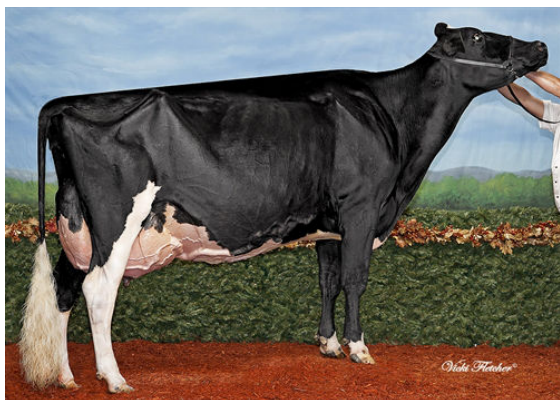
JACOBS GOLDWYN BRITANY FOURTH DAM