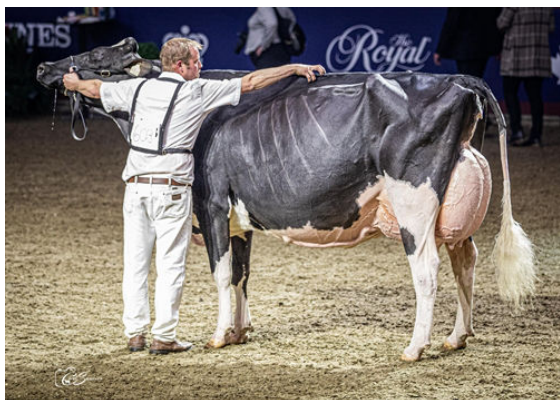
JACOBS HIGH OCTANE BABE THIRD DAM